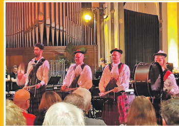
Afwisselend nieuwjaarsconcert door Klundertse Gardes