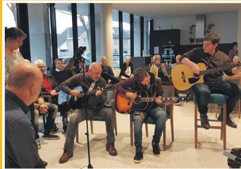
Jamsessie in Het Huis van de Wijk

Nummer 14 | Dinsdag 15 januari 2019 | week 3 | jaargang 2 | Stichting In de Klundert | redactie@indeklundert.nl | www.indeklundert.nl