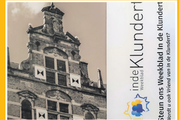
Bent u al vriend van In de Klundert