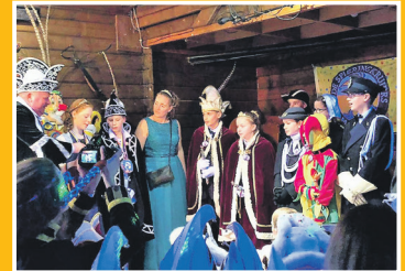
Feest met Jeugdraad Sprieringkruiers