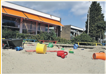
Slingers op Basisschool De Molenvliet

Nummer 16 | Dinsdag 29 januari 2019 | week 5 | jaargang 2 | Stichting IndeKlundert | redactie@indeklundert.nl | www.indeklundert.nl