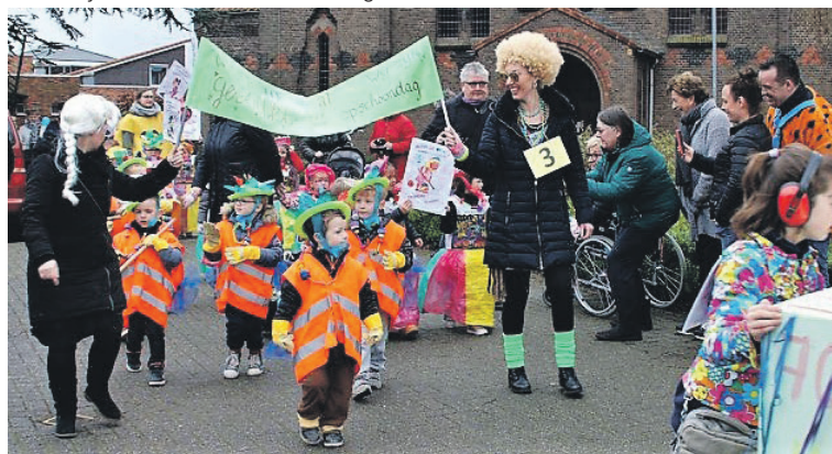
Kinderoptocht in Noordhoek

Ook in het Spieringkruiersdorp weten ze wat feesten is. Op De Klaverhoek hadden ze deze keer een verlengde schooldag. De hele ochtend werden er allerlei spelletjes gedaan zoals spek happen, prinsje prik en een ballonnenrace. Tussendoor natuurlijk tijd voor de polonaise en als lunch kregen de kinderen allemaal heerlijke pannenkoeken. Na het eten werd er nog even buiten gespeeld en na een laatste feestdans kon ook in Moerdijk de vakantie van start gaan.