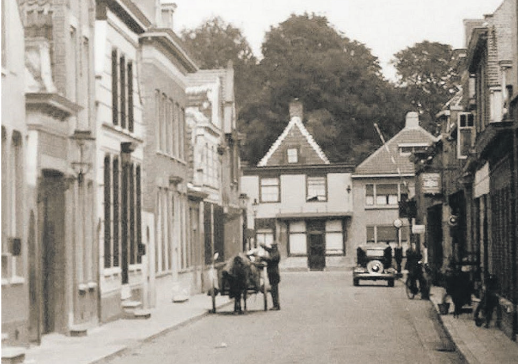
Voorstraat anno 1937