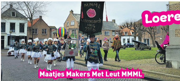
Maatjes Makers Met Leut MMML