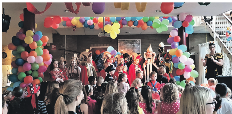
Feest op Basisschool De Rietvest

Vrijdag was het feest op een aantal basisscholen in Klundert, Moerdijk en Noordhoek. Overal de plaatselijke prinsen, jeugdprinsen, narren en prinsessen te gast om het feest mee te vieren.