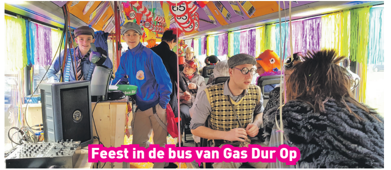
Feest in de bus van Gas Dur Op