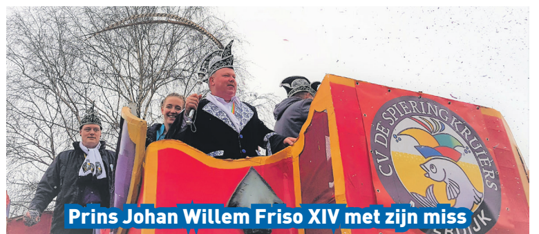
Prins Johan Willem Friso XIV met zijn miss