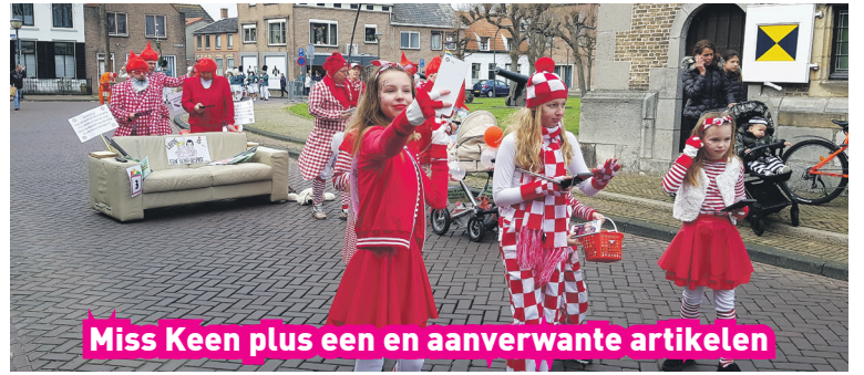
Miss Keen plus een en aanverwante artikelen