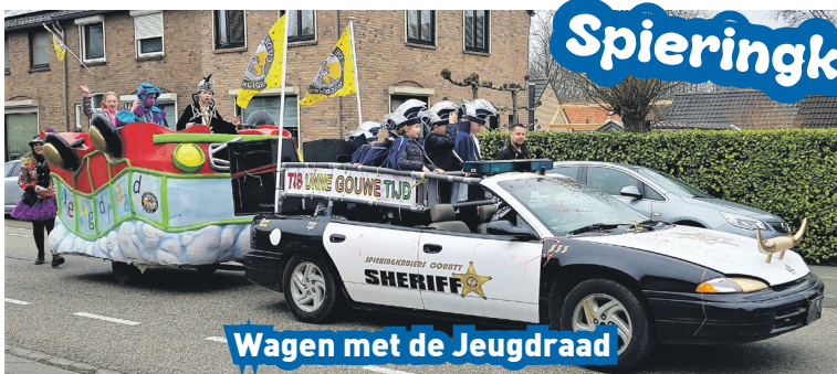
Wagen met de Jeugdraad