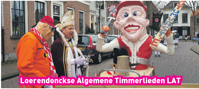
Loerendonckse Algemene Timmerlieden LAT