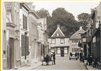
Klundertse straatnamen deel 8

Nummer 21 | Dinsdag 5 maart 2019 | week 10 | jaargang 2 | Stichting IndeKlundert | redactie@indeklundert.nl | www.indeklundert.nl