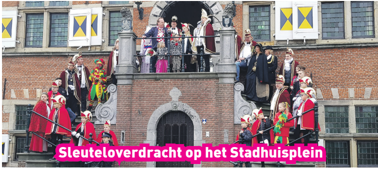
Sleuteloverdracht op het Stadhuisplein