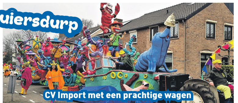
CV Import met een prachtige wagen