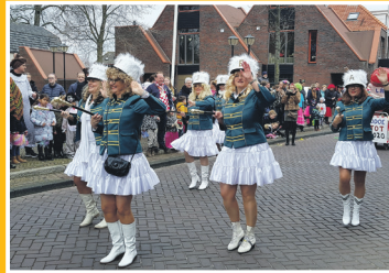
Leut in de regio