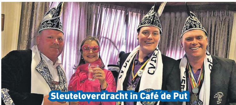
Sleuteloverdracht in Café de Put