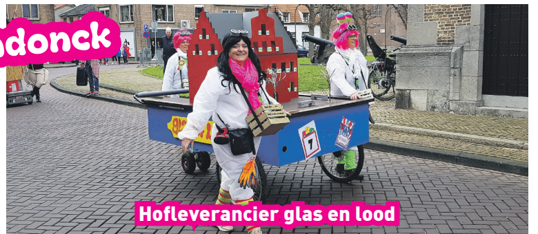
Hofleverancier glas en lood