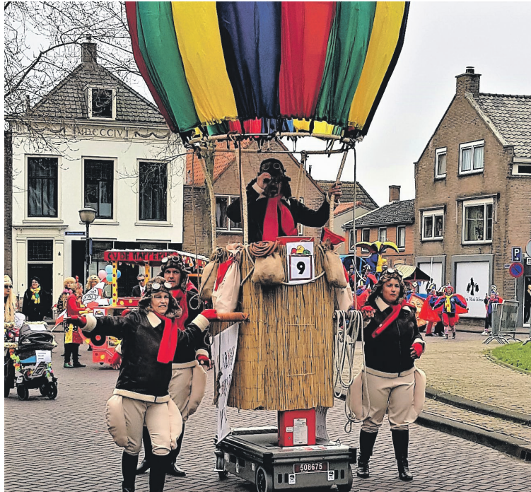
Winnende groep in categorie C: We doen mar un dotje

Het was niet zo'n lange optocht, maar wel een hele leuke sliert waarbij de deelnemers het motto prima hadden uitgewerkt, maar waar zeker ook actuele zaken aan bod kwamen.