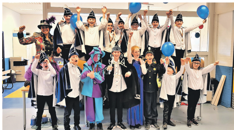
De jeugdgraad van de Spieringkruiers