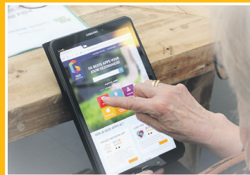
Inlooppunt digitale wereld