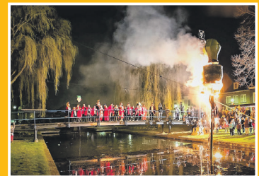
Carnaval Loerendonck was fantastisch

Veel belangstelling voor Event Lang Leve Lekker