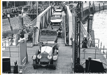
Lezing veerponten en Moerdijkbruggen

Nummer 23 | Dinsdag 19 maart 2019 | week 12 | jaargang 2 | Stichting IndeKlundert | redactie@indeklundert.nl | www.indeklundert.nl