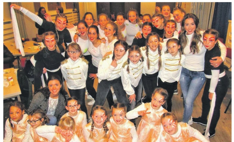
Dansgroepen in actie