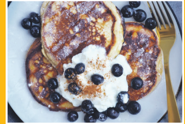
Vrijdag 22 maart: Nationale Pannekoekendag