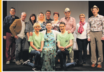
Toneelvereniging Moerdijk met Schaduwen