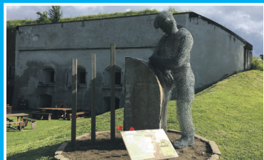
Beeld voor Walter Veness