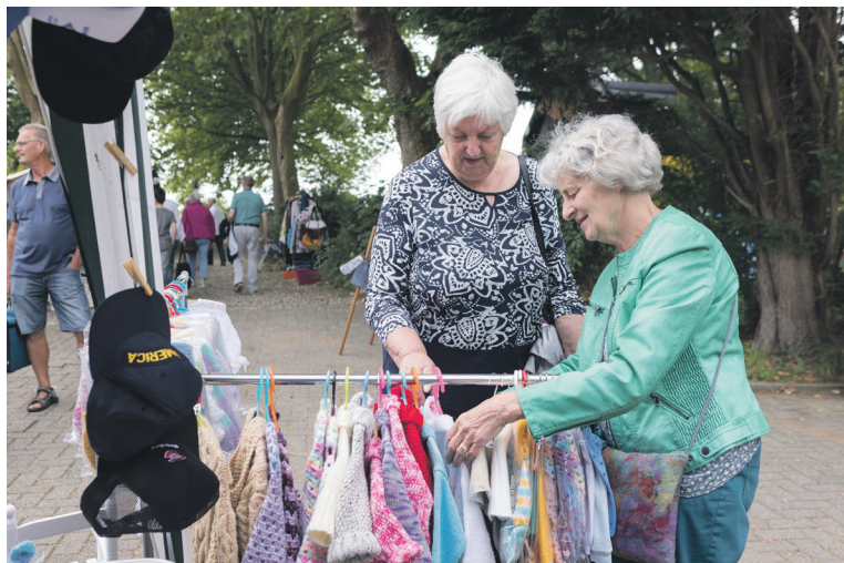
Gehaakte en gebreide kleding en aanverwanten staan dit jaar centraal op de Ruigenhilfair. Archiefphoto 2018

OUDEMOLLEN - In het laatste weekend van juni houdt de Prullenkast voor de 12e maal de Ruigenhilfair. Midden in de Ruigenhilpolder van Willemstad zullen rond de 17e eeuwse boerderij aan de Zuidlangeweg te Oudemolen circa 50 standhouders staan die hun kramen sfeer hebben ingericht. Deze buitenfair is boordevol producten van kunstenaars, hobbyisten, ambachtslieden, brocante en curiosa, verzamelaars, tuin- en woonaccessoires en wellness met diverse workshops en demonstraties. Voor kinderen o.a. springkussen, sieraden maken, kaarsen maken.