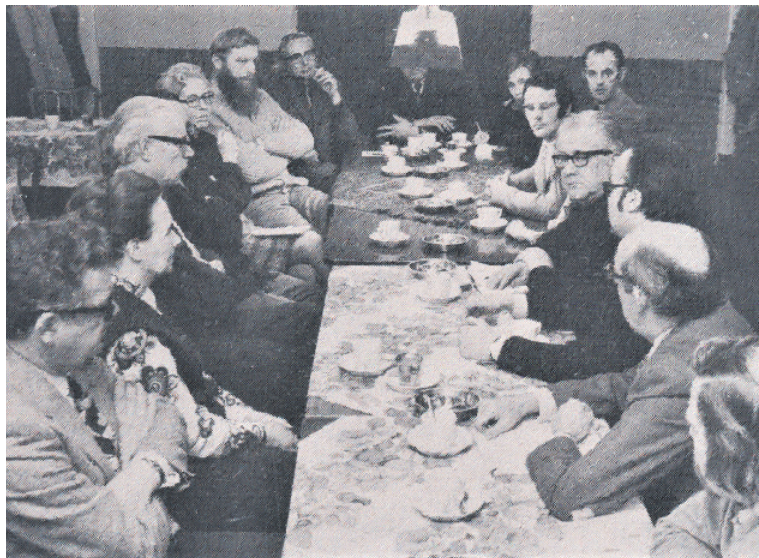
De werkgroep bereidt de oprichting van 'Die Overdraghe' voor.

KLUNDERT - Aanstaaende vrijdag, zaterdag en zondag wordt in Klundert weer de jaarlijkse braderie gehouden, deze keer met als nieuwe naam Klundert op een Kluitje. Dit jaar is het 45 jaar geleden dat "Die Overdraghe" werd opgericht. En dat wil men tijdens de eerste "Klundert op een kluitje" herdenken. Niet met een kraam, maar net zoals de laatste jaren met een tentoonstelling getiteld "45 jaar Die Overdraghe" in De Stad Klundert.