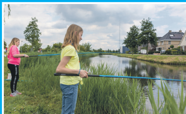
Beet met schoolvissen