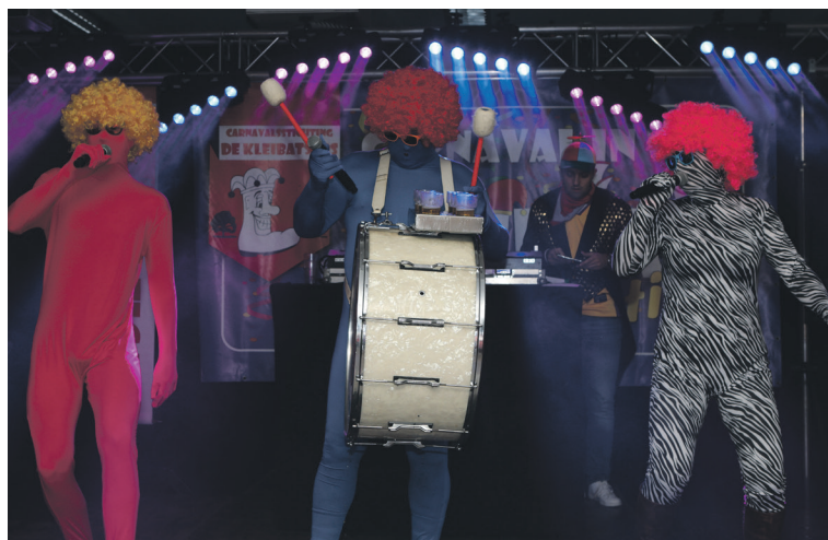
Een van de vele spraakmakende optredens tijdens de Leuke Liedjesfestivals in afgelopen jaren

FIJNAART - Het lijkt nog erg ver weg maar de tijd vliegt. Mensen hebben het druk en de agenda's lopen vol. Vandaar dat carnavalsstichting de Kleibatsers jou er alvast maar op attendeert, want je wilt het vast niet missen: dun ellufde van dun ellufde viering!