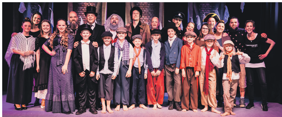
De zaterdag/zondag-cast met de medewerkers achter de schermen.

FIJNAART/HELWIJK - Met een afterparty neemt Toneelclub Fame uit Helwijk afscheid van de succesvolle productie Oliver! Vier keer brachten de kinder- en volwassencast een prachtige voorstelling op de planken van de Blokhut. De stijgende lijn die vorig jaar was ingezet met Annie werd dit keer doorgetrokken. Het spel en de zang waren van een uitstekende kwaliteit. Daar mogen alle deelnemers trots op zijn.