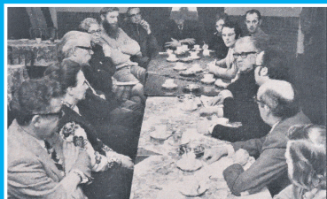
45 jaar heemhundekring