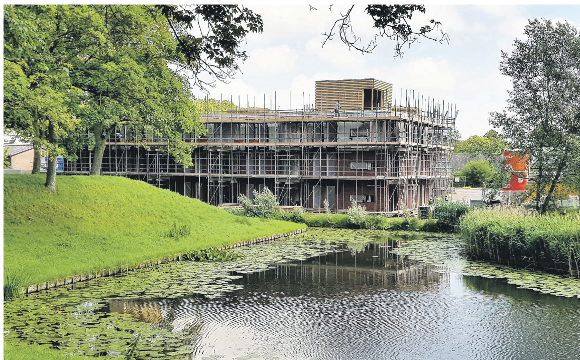
Nieuwbouw appartementencomplex Keense Gorzen - Foto Anjo van Tilborgh.

KLUNDERT – Keense Gorzen is de naam van het nieuwe appartementencomplex aan de Moye Keene in Klundert. Deze naam is bedacht door Heemkundekring Die Overdraghe. Tijdens de feestelijkheden vanwege het bereiken van het hoogste punt werd de naam onthuld door de bestuursleden Kees Hendriks, An Römer en Ellen van Hattum.