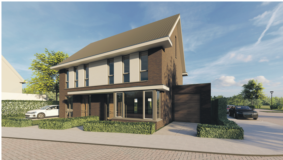
Een voorbeeld van een woning, gebouwd via een CPO-project.

De gemeente Moerdijk is van plan om in het westen van Fijnaart, naast de Parel, ruim honderd vrije kavels uit te gaan geven waar iedereen zelf een woning op kan realiseren. Ongeveer twee jaar geleden is met een aantal geïnteresseerden CPO Fijnaart opgericht om hiermee uiteindelijk allemaal hun droomhuis te gaan bouwen in plan Fijnaart West, oftewel Waterwijk Fijnaart.